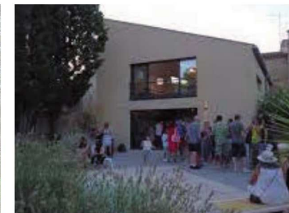
Studio Via, Fontcouverte