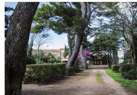
Maison du Parc, Rustiques